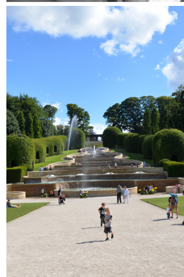
FOTO'S: STEVEN RICHARDSON (PORTRAIT LAURENCE MACHIELS), ©INGENIUS (PORTRAIT JACQUES WIRTZ), LAURENCE MACHIELS